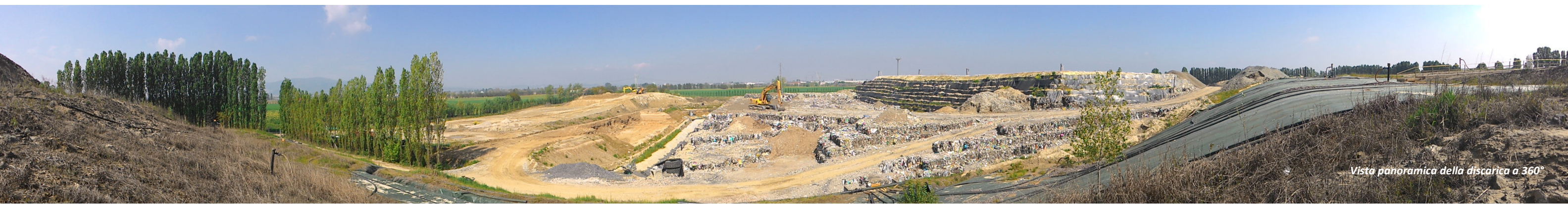
Vista panoramica della discarica a 360°

La copertura provvisoria (130 cm di terreno argilloso), funzionale a limitare l'infiltrazione di acqua piovana in attesa di realizzare la copertura definitiva, era stata ultimata nel corso del 2010. Dal 2011, per porzioni successive, la discarica è stata coperta, a titolo sperimentale, con teli in PE per limitare l'infiltrazione di acqua piovana (vasche da VI a XI). Dal 2013 è iniziata la stesa della copertura definitiva, come da progetto approvato, che ha interessato nel 2016 entrambi i lotti AB e CD fino alle vasche V.